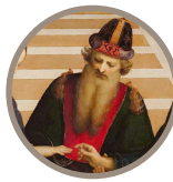
Sala 24 Spasmodic Virgin Raffaello Sanzio 1504