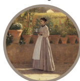
Room 38 After lunch (The trellis) Silvestro Lega 1868