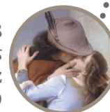
Room 38 The kiss Francesco Hayez 1859