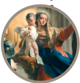
Sala 34 Madonna del Carmelo Giambattista Tiepolo 1727 circa

Ritratti dei Maestri di Brera Portraits of Brera's masters