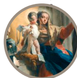
Room 34 Our Lady of mount Carmel Giambattista Tiepolo Circa 1727

Ritratti dei Maestri di Brera Portraits of Brera's masters