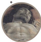
Sala 6 Cristo morto Andrea Mantegna 1474 circa