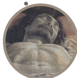
Room 6 Lamentation over the dead Christ Andrea Mantegna Circa 1474