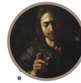
Sala 28 Cena in Emmaus Caravaggio (Michelangelo Merisi) 1606 circa

Il naturalismo: i pittori romani e napoletani dopo Caravaggio Naturalism: Roman and Neapolitan painters after Caravaggio