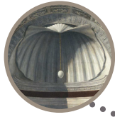
Room 24 Montefeltro Altarpiece Piero della Francesca Circa 1472

click on the image and listen or read the historical-artistic description