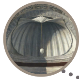
Sala 24 Pala Montefeltro Piero della Francesca 1472 circa

clicca sull'immagine e ascolta o leggi la descrizione storico-artistica