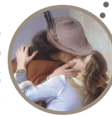
Sala 38 Il Bacio Francesco Hayez 1859