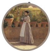
Sala 38 Un dopo pranzo (il pergolato) Silvestro Lega 1868