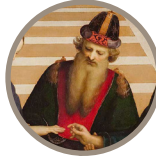
Room 24 Marriage of the Virgin Raffaello Sanzio 1504