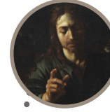
Room 28 Supper at Emmaus Caravaggio (Michelangelo Merisi) Circa 1606

Il naturalismo: i pittori romani e napoletani dopo Caravaggio Naturalism: Roman and Neapolitan painters after Caravaggio