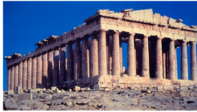
Partenone (Ictino) Atene (V sec. a.C.) greco classico