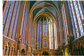
Sainte Chapelle Parigi (1248) gotico