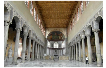
Santa Sabina Roma (V sec.) paleocristiano