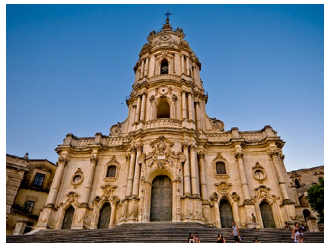
San Giorgio Modica (XVIII sec.) barocco