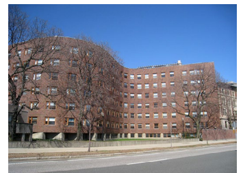
Baker House (Alvar Aalto) Cambridge, USA (1946) organicista