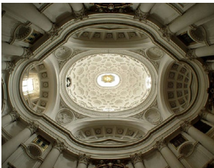
San Carlino alle 4 fontane (Francesco Borromini) Roma (1644) barocco