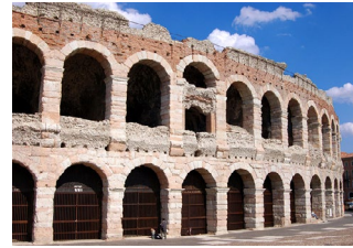
Anfiteatro (Arena) Verona (I sec. d.C.) romano