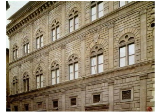
Palazzo Rucellai (L.B. Alberti) Firenze (1451) rinascimentale