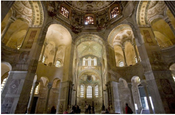
San Vitale Ravenna (532-547) bizantino