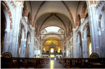
Sant' Ambrogio Milano (1099) romanico