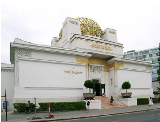
Palazzo della Secessione (Joseph Olbrich) Vienna, Austria (1898) secessionista