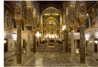
Cappella Palatina Palermo (1140) arabo-normanno