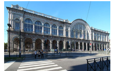
Stazione di porta nuova Torino (1861) eclettico