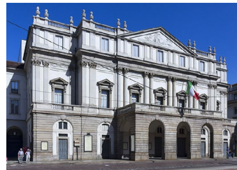
Teatro alla Scala (Giuseppe Piermarini) Milano (1778) neoclassico