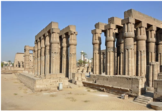
tempio di Luxor Egitto (XIV-XIII sec. a.C.) egizio