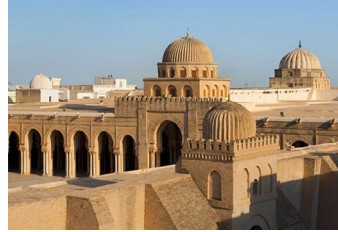
Moschea di Qayrawan Kairouan, Tunisia (VII-IX sec.) islamico