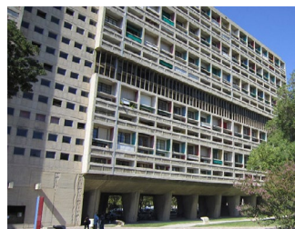
Unité d'habitation (Le Corbusier) Marsiglia, Francia (1947) razionalista