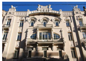
Palazzo (Mikhail Eisenstein) Riga, Lettonia (1914) art-nouveau