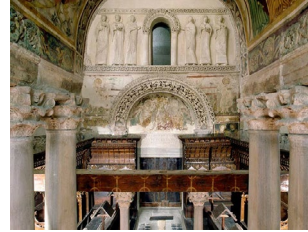
Santa Maria in Valle, Cividale del Friuli (744-756) longobardo